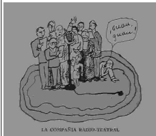
dibujo de Ramón para Páginas de Columba

RAMÓN GÓMEZ DE LA SERNA Buenos Aires, 1937