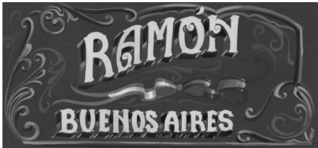
logotipo de las II Jornadas Internacionales Ramón Gómez de la Serna, Buenos Aires 2010

Ramón Gómez de la Serna (Madrid 1888 - Buenos Aires 1963) es, por la importancia y el volumen de su obra, uno de los más significativos escritores de lengua española del siglo XX. Se dedicó muy tempranamente a la literatura y al periodismo: su primera obra, Entrando en fuego , es de 1905. Desde entonces publicó un centenar de libros, en los que incursionó en casi todos los géneros e inventó otros, el más recordado de ellos, la greguería. Animó durante más de veinte años (1915-1936) la tertulia del café de Pombo, por la que pasaron escritores y artistas de todas las nacionalidades. El apogeo de su renombre internacional corresponde a las décadas de 1920 y 1930, cuando se constituyó en el principal divulgador de los movimientos de vanguardia en el ámbito hispánico. Amigo de Picasso, Ortega y Gasset, García Lorca, Buñuel, Dalí, Jean Cocteau..., toda su obra se inscribe bajo el signo de la renovación permanente, y ha sido equiparada por su influencia a la de James Joyce y Marcel Proust.